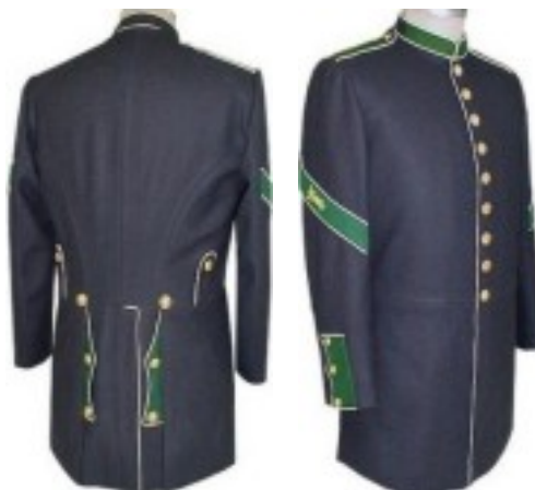
Uniform van de Steward.